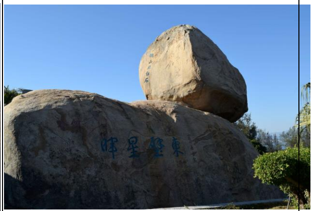
東山關帝廟著名景點風動石