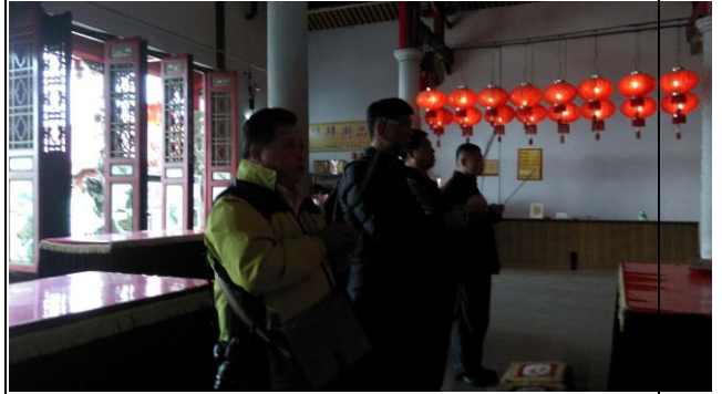
與台商會長在烏石天后宮參拜