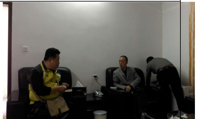
與東山關帝廟劉主委座談