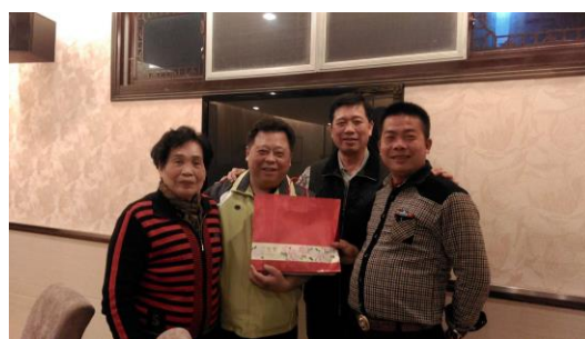
致贈關帝廟伴手禮