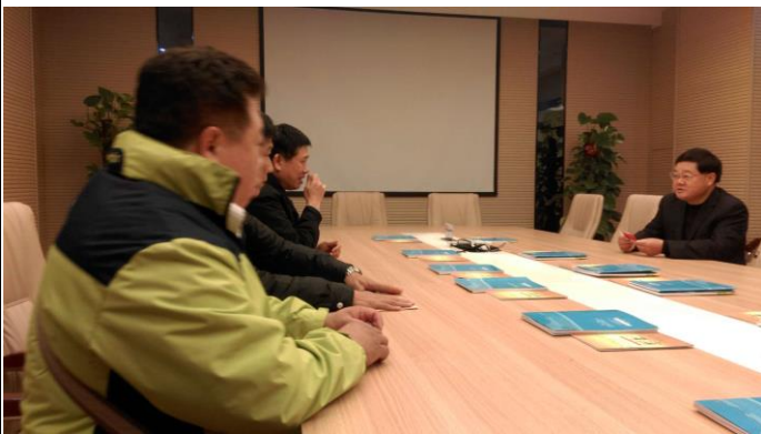
與漳浦縣旅遊局林局長座談