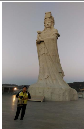
宮前天後宮媽祖雕像