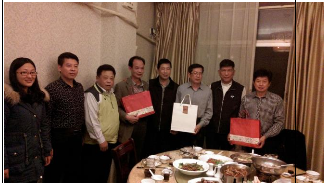
製贈漳州市及漳浦現台辦伴手禮