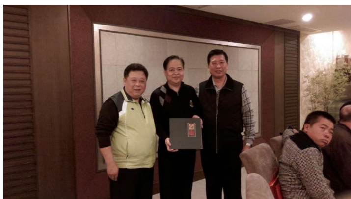
當地台辦致贈我方紀念品