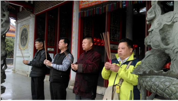
與台商會長在烏石天后宮參拜