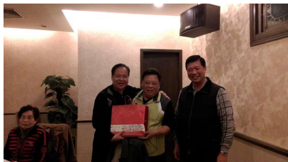
致贈當地台辦伴手禮