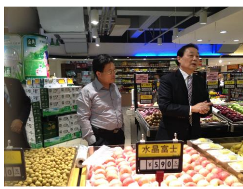
參訪國貿集團超市