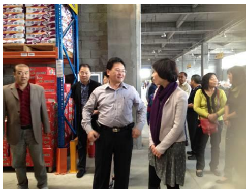
參訪雅斯集團物流中心