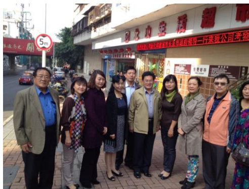
參訪宜昌市北山超市