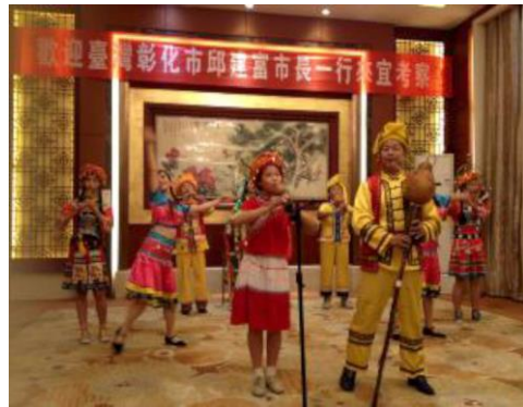
藝術家地方戲曲表演