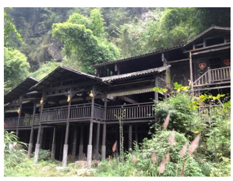
三峽人家景觀區參觀考察